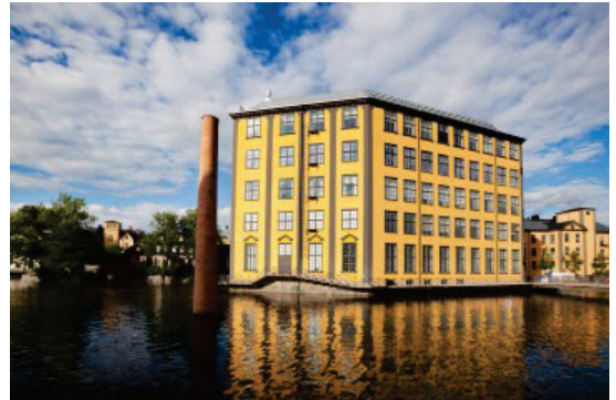
Fastighetsmarknadsdagen Östergötland 📅 2022-01-26