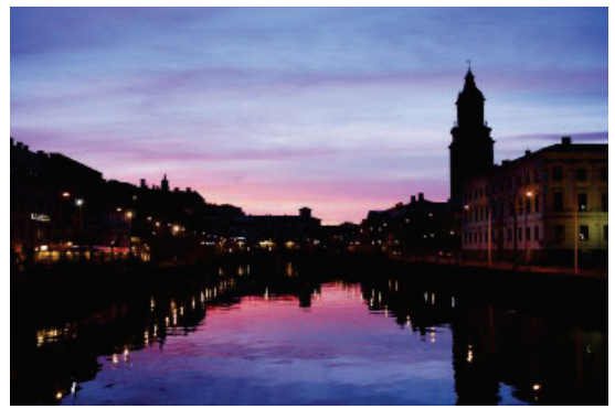
Lokalmarknadsdagen 📅 2022-01-20