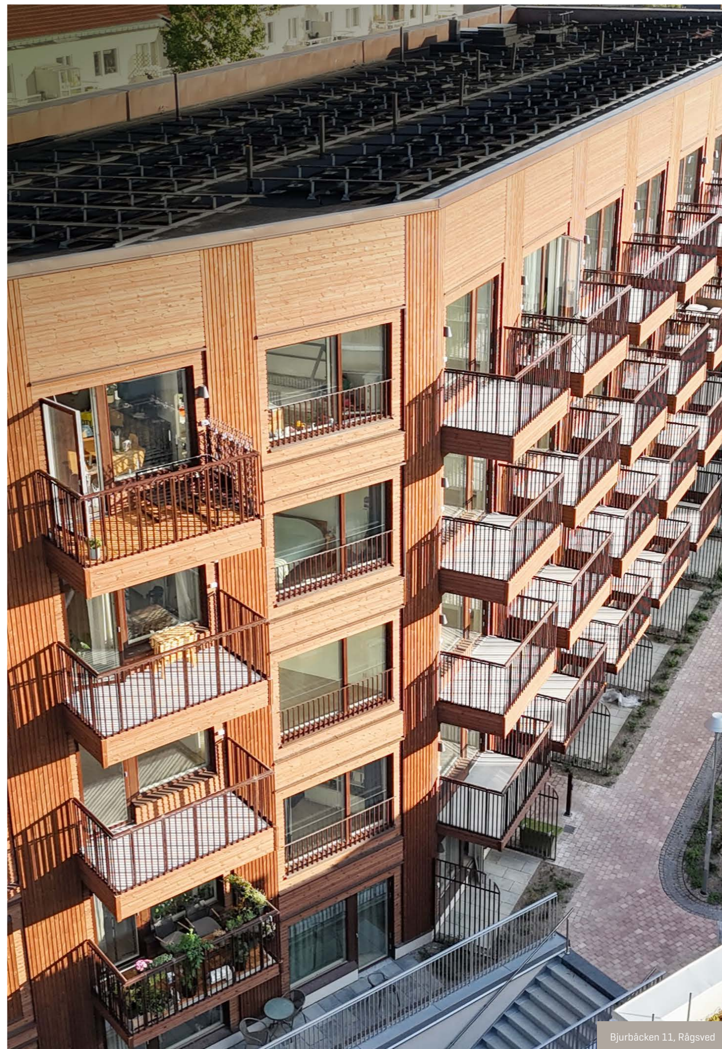
Bjurbäcken 11, Rågsved

Bolaget har under räkenskapsåret 2025 inte gjort sig skyldigt till några överträdelser av regelverket för Nasdaq First North Growth Market.